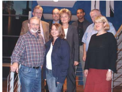
AK Balance von Familie und Beruf